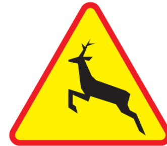
Rys. 2.2.20.2. Znak A-18b

Przez 63,5 zwierzyna często przekracza drogę?