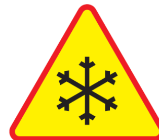
Rys. 2.2.34.1. Znak A-32

Znak A-32 „osronienie jezdni” (rys. 2.2.34.1) stosuje się wyłącznie w okresie zimowym przed mostami i wiaduktami, na których osronienie jezdni lub gołedź pojawia się w okresach, gdy jeszcze nie występuje na innych odcinkach drogi, np. na mostach z pomostem stalowym, oraz w pobliżu rzek i zbiorników wodnych, na których często zdarza się lokalne osronienie jezdni . Znak A-32 stosowany jako świetlny wskazuje rzeczywisty stan osronienia lub oblodzenia jezdni na podstawie pomiarów z urządzeń umieszczonych przy drodze lub na nawierzchni.