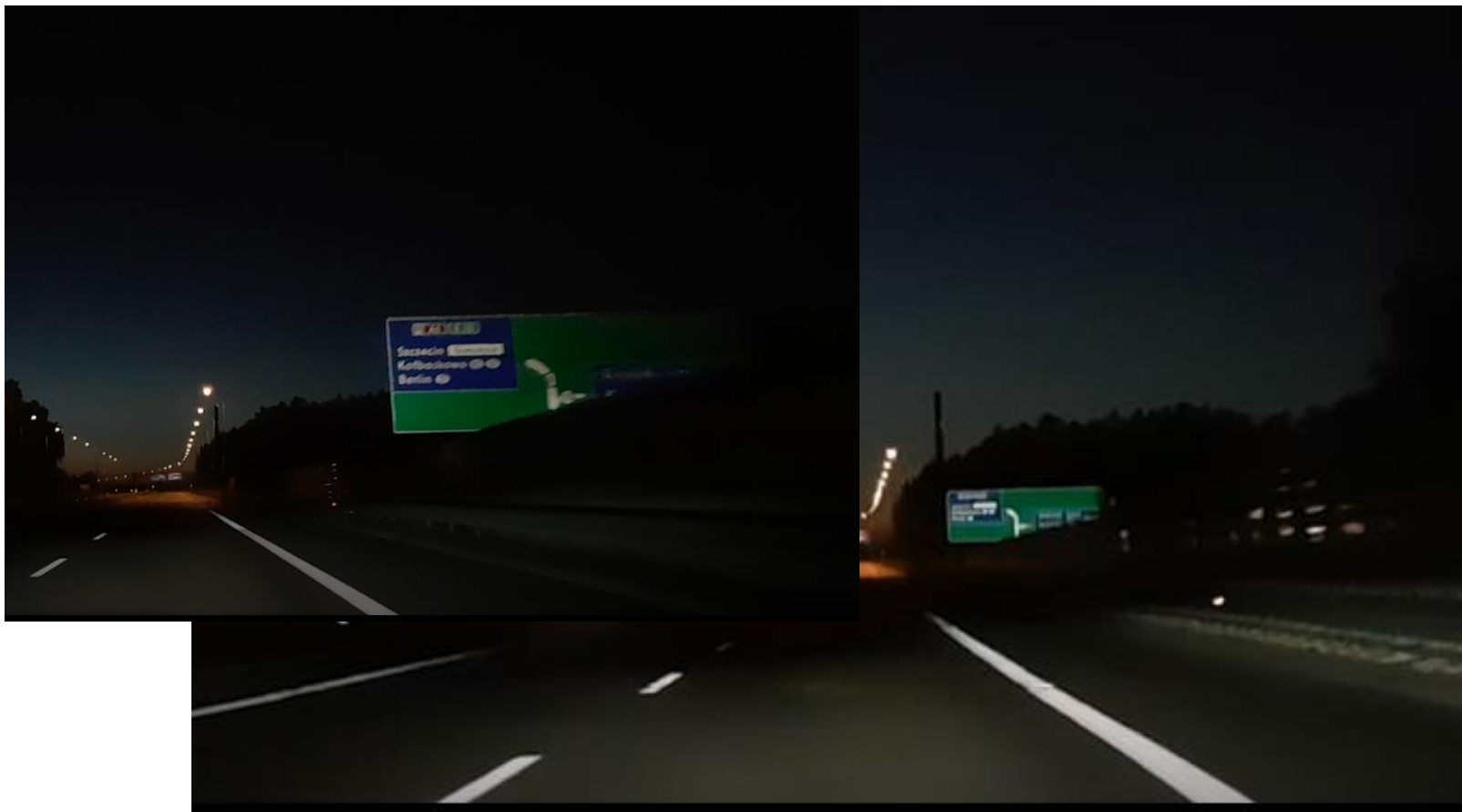
Tablica zasłonięta przez ekran akustyczny